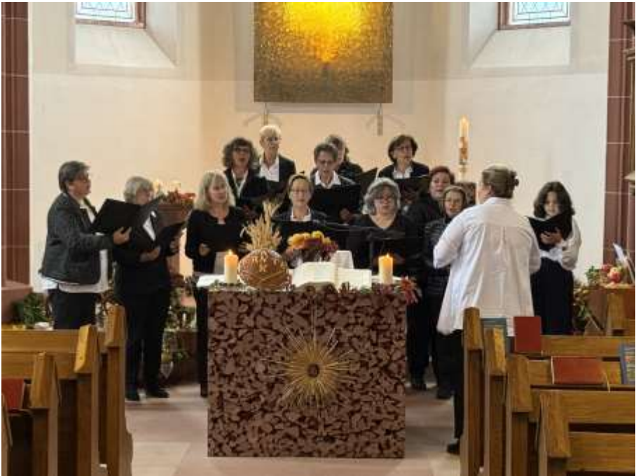
Der Chor Jubilate beim ersten Auftritt mit der neuen Chorleiterin am Erntedankgottesdienst.