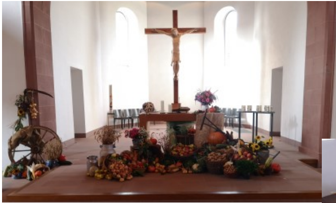
Der Erntedankaltar in Nassig