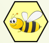
Unser Logo der Krippengruppe Bienennest

Aktuell besuchen 15 Kinder im Alter von 3-6 Jahren unsere Kitagruppe Bienengruppe und 4 Kinder im Alter von 1-3 Jahren unsere Krippengruppe Bienennest . Im Laufe des Kitajahres werden weitere Kinder hinzukommen, wobei die Tendenz von einjährigen Kindern laut bisherigen Anmeldungen zunehmen wird.