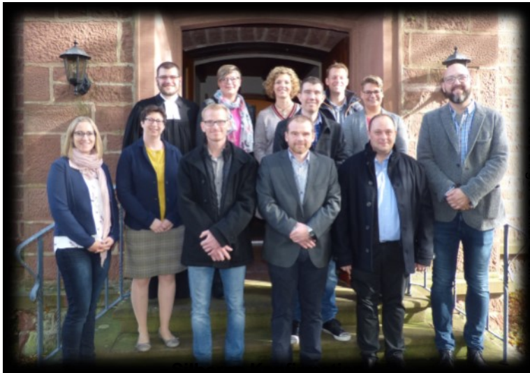
Silberne Konfirmation Gefeiert am 13. Oktober 2019 in der Friedenskirche Sonderriet